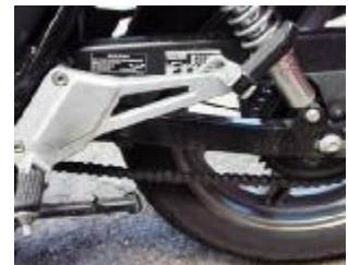
Billede 11; Kædens spillerum 2-4 cm

Kontrol: Løft op i kæden på midten og se spillerum. Forklar om baghjulsblokade.