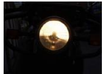
Billede 21; kun øverst!

Lovkrav: Skal lyse mindst 100m frem. Lyset skal være så kraftigt at man i mørke kan læse de små bogstaver i en avis 100 m fra motorcyklen. Brug: Ved kørsel på en uoplyst vej, når der ikke er andre du kan blænde.