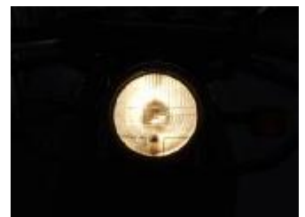
Billede 22; hele lygten

Lovkrav: Tydeligt kraftigere end baglyset. Pæren er mindst 3½ gang så kraftigt som baglyset i watt-styrken.