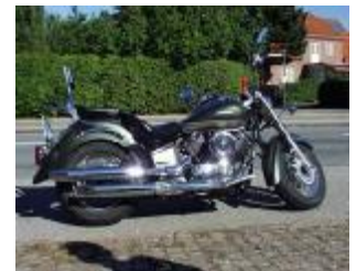
Billede 24; unødigt støj og røg er ulovligt!