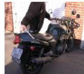
Billede 3; skub!