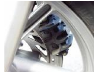
Billede 16; klodserne set fra indersiden.

Kontrol: Træd på bremsen og se hvor meget bremsebakkerne er slidt, Hvis pilen peger på den venstre kant skal der nye