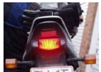
Billede 23; 3,5 x baglyset

Kontrol: Træd på fodbremsen og aktiver håndbremsen. Se om bremselyset virker.