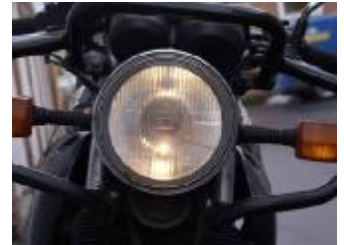
Billede 19; ses 300 m væk

Positionslýset skal tænde som det første lys. Det skal markere mc'en på en uoplyst vej. Brug: Ved parkering på en uoplyst vej.