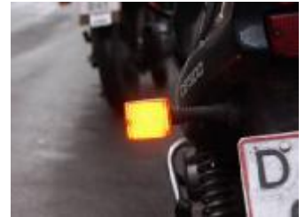
Billede 24; Ses i solskin og 60-120 blink pr. min.

Kat A – lille, rækker kun til mc'er op til 34 hk.