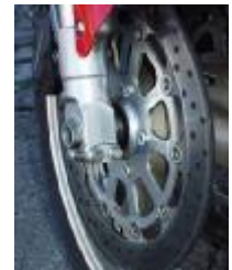
Billede 6; her 2 sikringsbolte