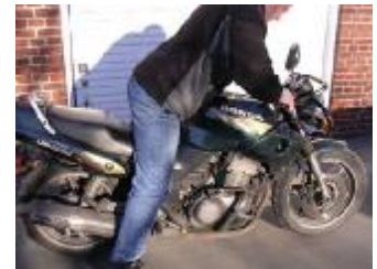
Billede 9; Tryk til!

Kontrol: (billede 9) Stig op på cyklen, tag forbremseren og pres hurtigt og hårdt forgafelen helt i bund. Slip, og gaffelen skal falde til ro med det samme. Den må ikke hoppe videre. Se efter ned af gaffelen om den lækker olie. Støddæmpere bag: (billede 10) Hop i sædet så du presser støddæmperne helt sammen og slip, se om mc'en hopper videre efter du har sluppet. Se efter på ydersiden af dæmperne om de lækker olie.