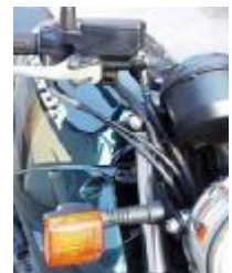
Billede 14; følg slangen.

Kontrol: (billede 14) Følg slangen ned til hjulet, se efter utætheder ved banjoboltene der skruer slangen fast til hovedcylinderen og kaliberen ved hjulet. Se efter revner hvis slangen har været i klemme. Den skal sidde i de bøjler der forhindre den klemmes.