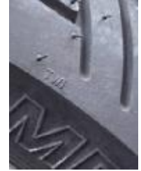
Billede 8; TWI

Kontrol: (billede 8) Forklar om kravet til slidbanen og farligheden i beskadigelser på siderne. Find slidgrænseindikatoren ud for mærket "TWI". Se efter en pil på siden. Dæktrykket står ofte på siden af kædeskærmen, men ikke på siden af dækket da det kun er maks-trykket dækket kan tåle.