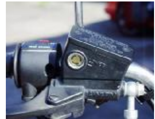
Billede 12; væskestand

Kontrol: (billede 12) Se efter bremsevæske i det lille øje eller ved stregen rundt om beholderen. Der skal være væske op over minimumsmærket. Hvis der mangler væske er der måske en utæthed eller bremseklodserne er nedslidte. Når klodserne bliver tyndere må stemplet bag ved klodserne bevæge sig længere ud, her bliver der så mere plads, så væskestanden i beholderen synker. Slidte klodser giver derfor lav stand.