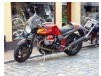
Billede 25; Stor MC over 34 hk, (Guzzi 1100)