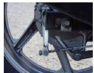
Billede 18; Bremsearm, stang og slidviser