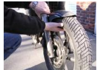
Billede 7; ryk fra side til side og hold fast i gaflden