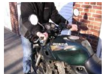
Billede 4; træk hårdt ind mod dig selv derefter vrid hjulet i gafflen.