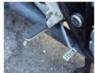
Billede 17; bremsepedalens vandring?