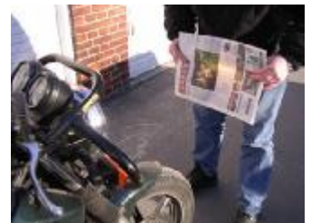
Billede 20; 30 m og en avis

Kontrol: (billede 20, 21) Gå tæt på. forlygten så den lyser på dine bukser, gå nu 10 skridt væk og lyset skal nu være faldet 10 cm. Se om der kun er lys i lygtens øverste halvdel.