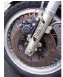
Billede 5; gliderør.

Lovkrav: Der skal mindst være 1 mm slidbane og dæktryk efter instruktionsbogen. Dækket må ikke være beskadiget på siderne og ikke mørnet af sol og fugt. Mange dæk må kun køre en vej rundt så mønsteret slynger vandet væk og vævningen passer til bremsning eller acceleration. Der er så en pil på siden.