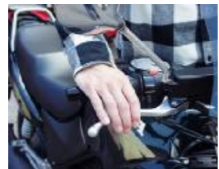
Billede 13; frigang og vandring på grebet.

Lovkrav: Mindst 1 cm frigang før bremsen bremser. Mindre frigang betyder at bremseklodserne måske hænger så bremsen løber varm. Længste vandring mod styret før der bremses: \frac{2}{3} fra yderstilling på skivebremsemodeller og kun \frac{1}{2} på ældre med tromlebremser.