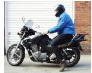
Billede 10; hop i sædet!

Lovkrav: Kæden skal være korrekt spændt, ikke for slap og ikke for spændt da den kan knække. En slap kæde kan køre ved siden af tandhjulet så den blokerer baghjulet. Spillerum normalt 2-4 cm.